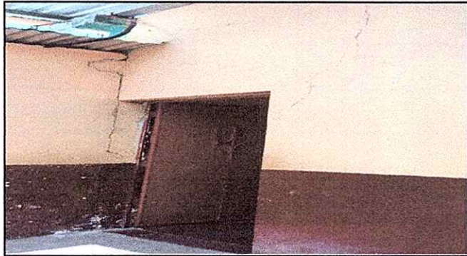
Foto 1: Se observa la pared dañada y deteriorada en mal estado modulo 2