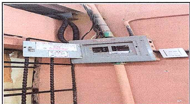
Foto 4: Se observa la falta de mantenimiento de la caja de fusibles afectando focos, enchufes, y equipo de computo ocasionando bajones de energía eléctrica modulo 1.