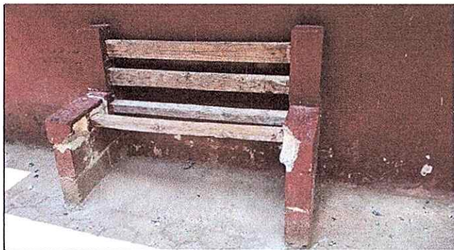
Foto 3: Se observa las paredes del zocalo en mal estado y deterioradas, modulo 2