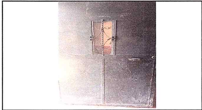
Foto 2: Se observa el deterioro de las puertas y la pintura en mal estado modulo 2