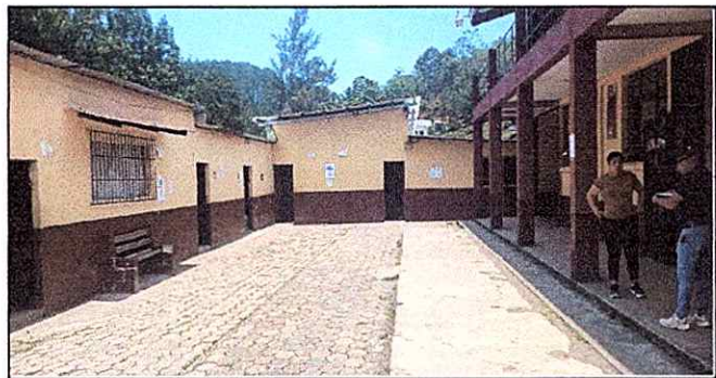
Foto 6: Se observa el desnivel del patio central afectando acumulación de agua fluvial en los alrededores modulo 2

Observación: Si es necesario se pueden agregar hojas adicionales y actualizar el número de hojas.